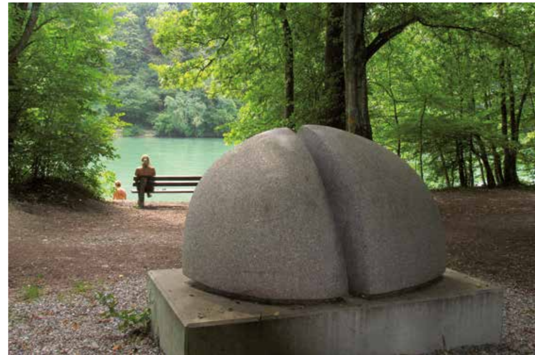
«Dipylon» Schwarzwälder Granit 2,4x1,2x1,2m

Lebt und arbeitet freischaffend in Dachsberg, Deutschland