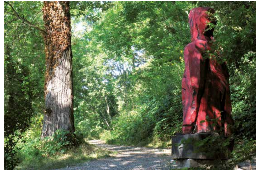
«Die Rote». Material: Zedernholz Masse: 3 Meter hoch