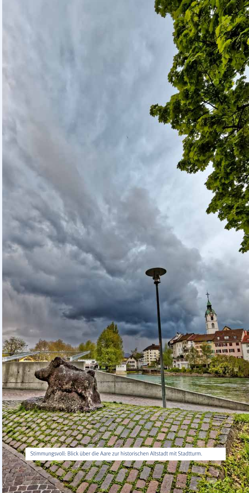
Stimmungsvoll: Blick über die Aare zur historischen Altstadt mit Stadtturm.

Pro Kultur Olten 📍 www.pro-kultur-olten.ch