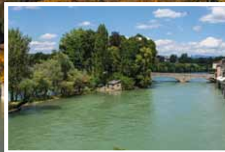
Burgstell und Inseli La petite île