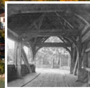
Die ehem. Holzbrücke (bis 1897) Le vieux pont de bois (jusqu'en 1897)