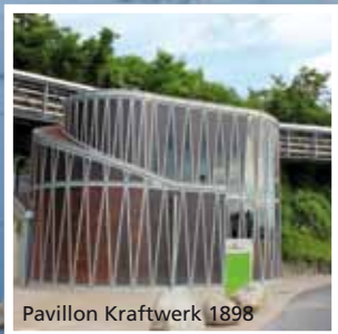
Pavillon Kraftwerk 1898

Wo einst das imposante Maschinenhaus des Wasserkraftwerks von 1898 stand, liegt heute der Mündungsbereich des neuen Gwild-Biotops im ehemaligen Oberwasser-Kanal. Hier wurde eine europaweit einzigartige ökologische Ausgleichsmaßnahme verwirklicht. Mit rund 900 m Länge und 60 m Breite erfüllt das Umgebungsgewässer die Funktion eines Nebenflusses mit Laich- und Aufstiegsqualität und ersetzt zudem zu weiten Teilen die natürliche Felslandschaft im Fluss, die im Unterwasser des neuen Kraftwerks ausgeräumt werden musste. Aussichtskanzeln und ein Böschungsweg lassen den Spaziergänger diese beeindruckende Flusslandschaft erleben und geben den Blick frei bis zum neuen Kraftwerk.